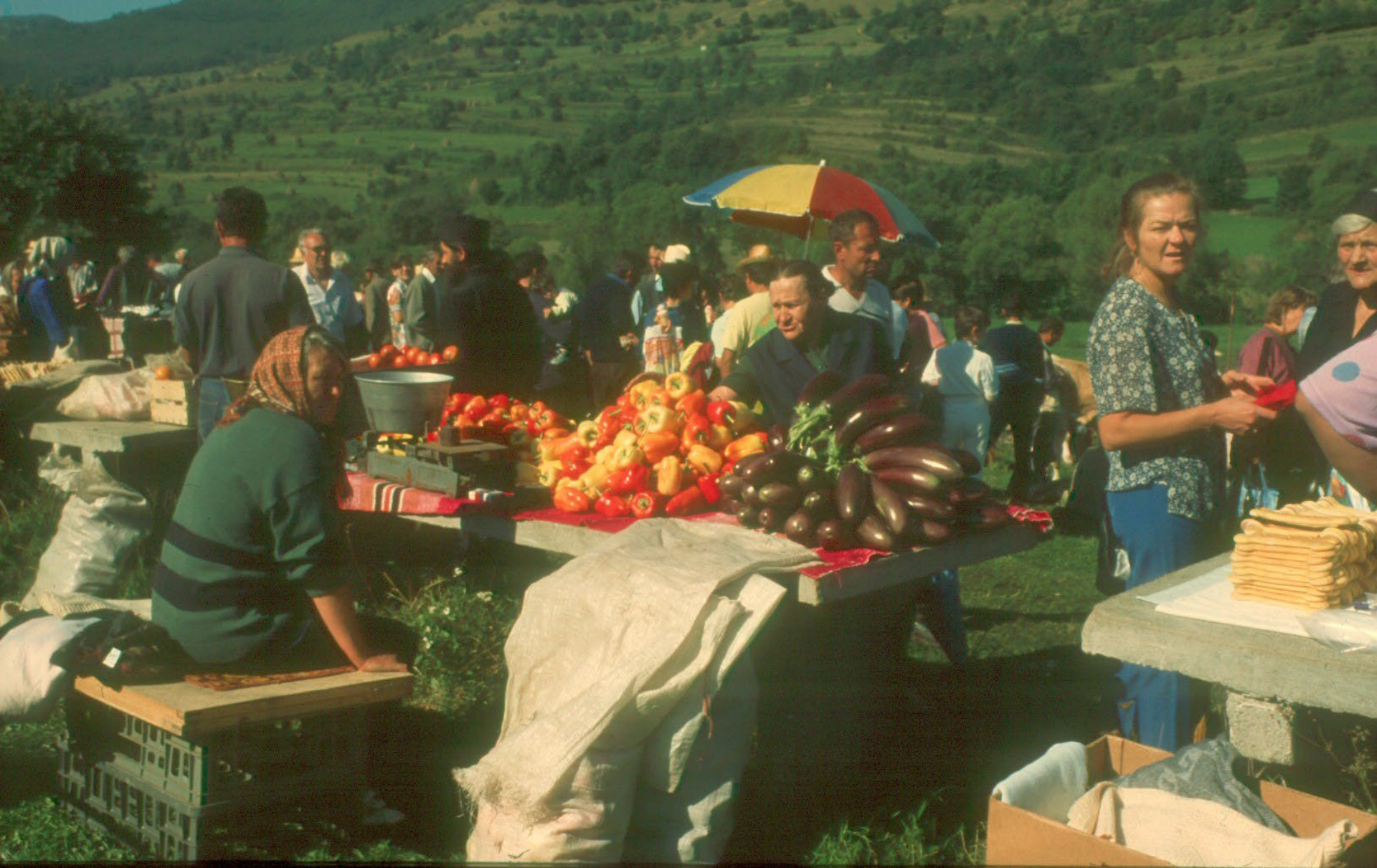
Torockói nyári vásár a borrhév felé vezető út mellett