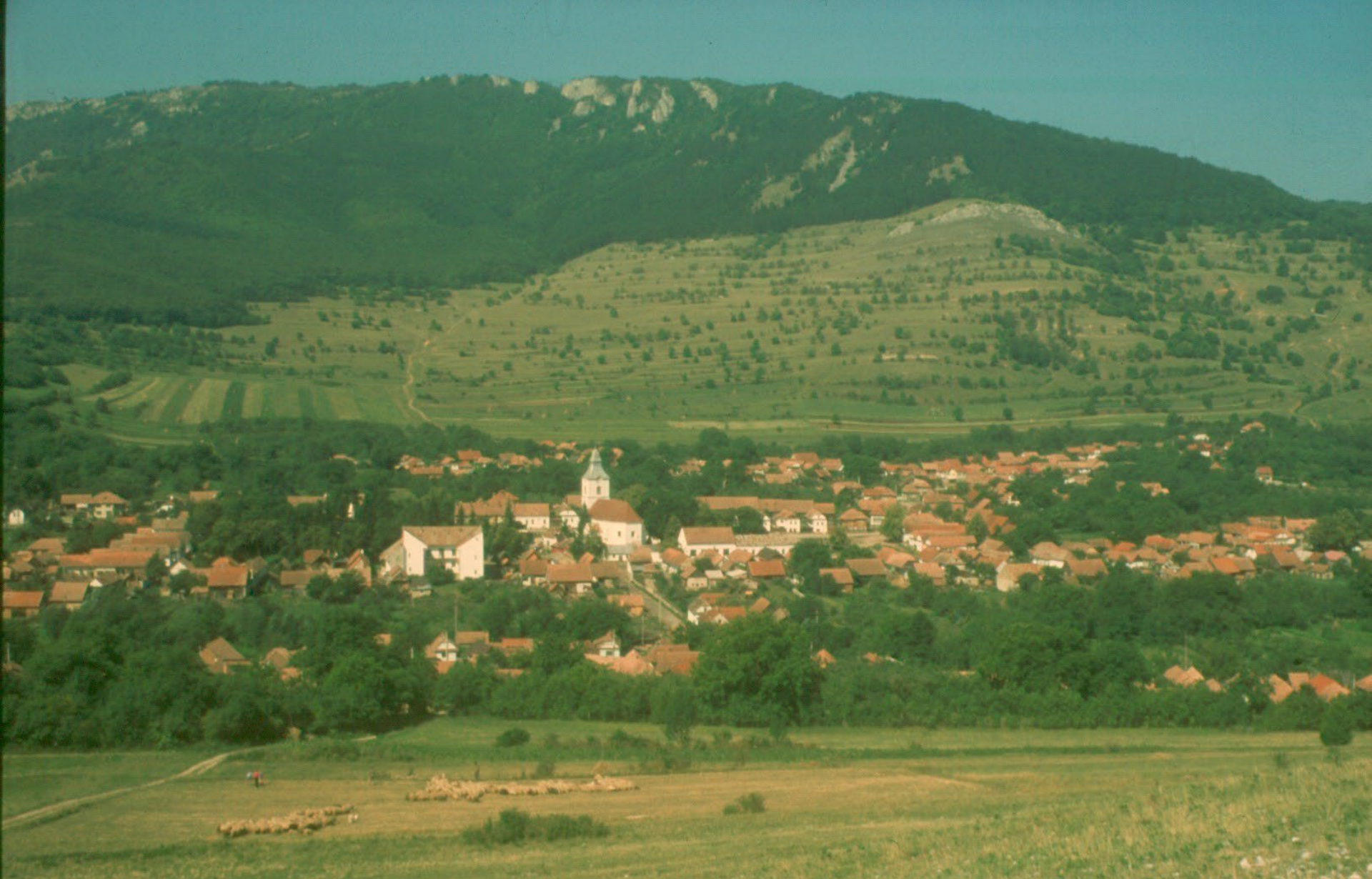
Torockó község, háttérben a Tilalmassal