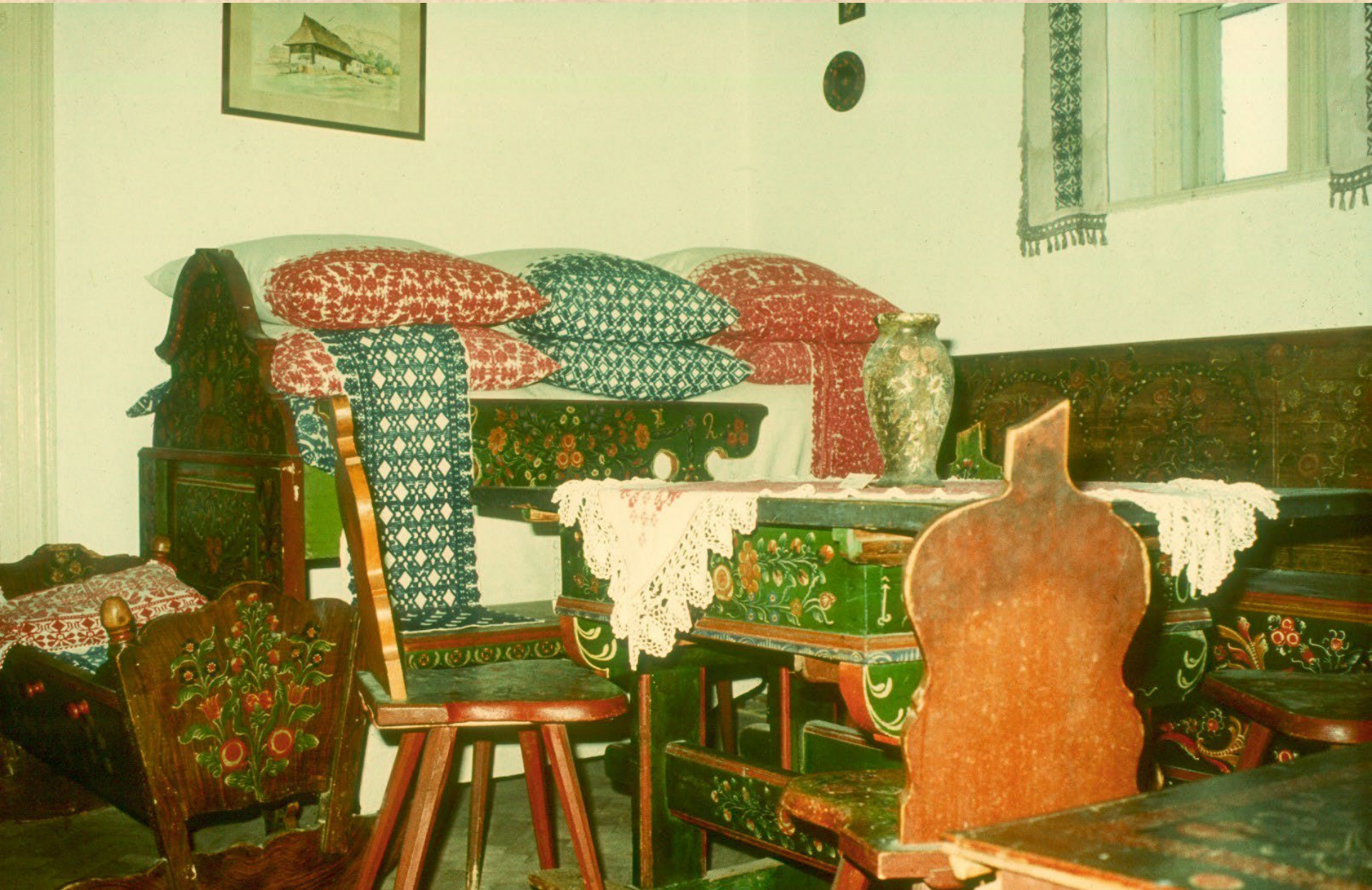
Szobabelső a torockói múzeumban