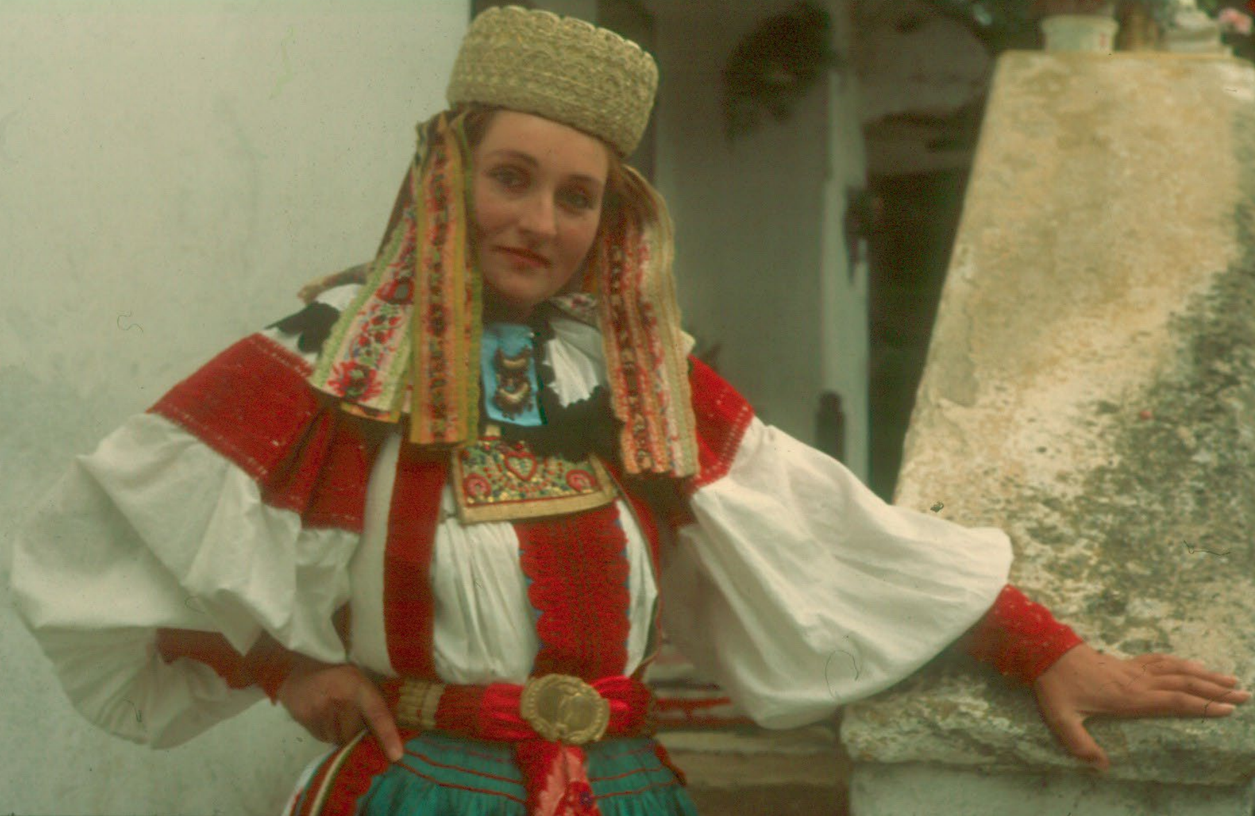
Torockói menyecske népviseletben