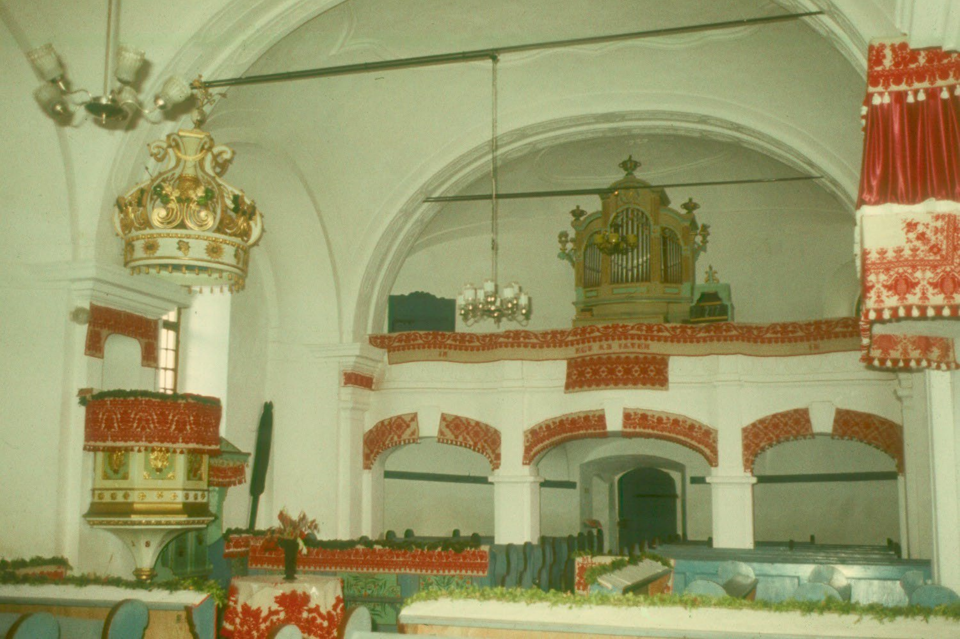
A torockószentgyörgyi unitárius templom