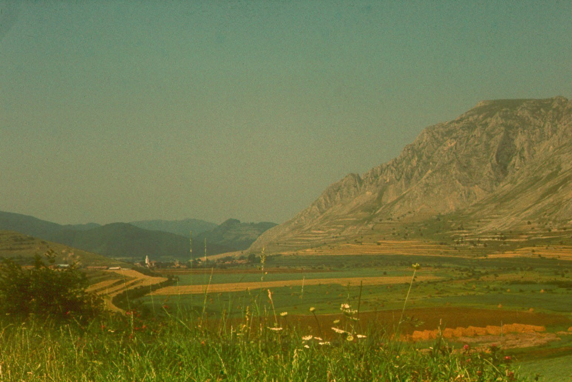
A Székelykő Torockószentgyörgy felől, háttérben Torockóval