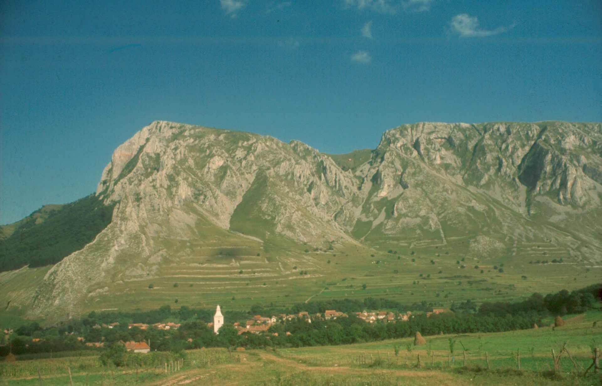
A Székelykő Tilalmas felől nézve, előtérben Torockó