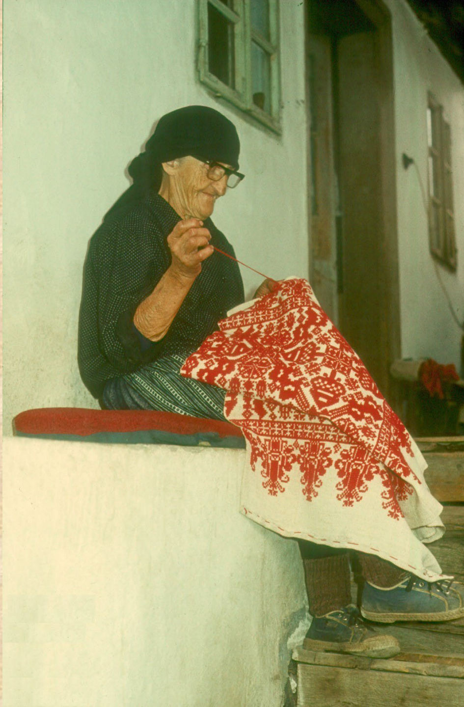
Hímezgető torockói asszony