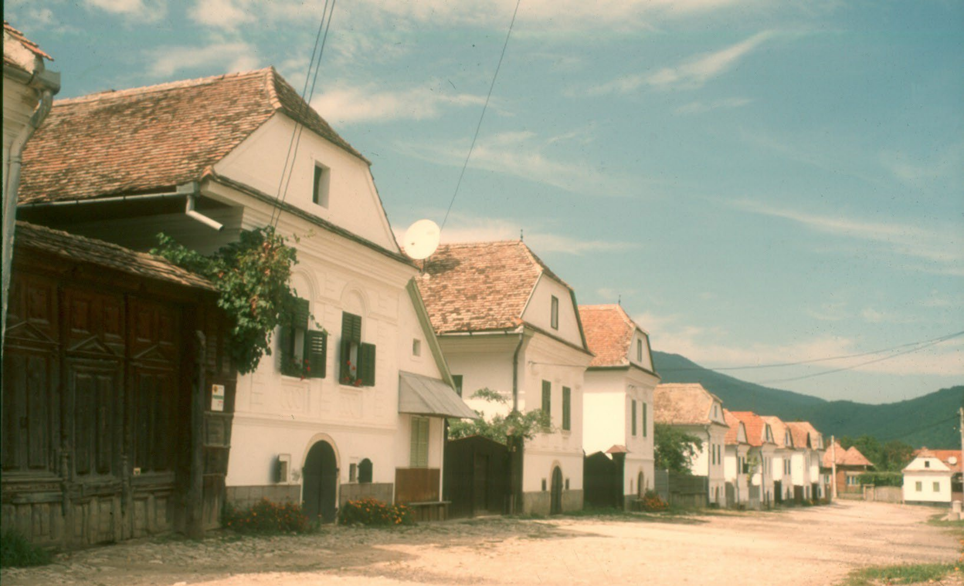
A világörökség Felső-piaci házsora Torockón