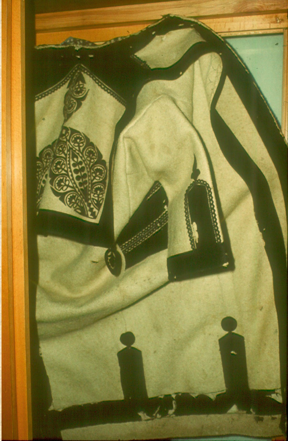
Hímzéssel díszített férfi posztó szűr