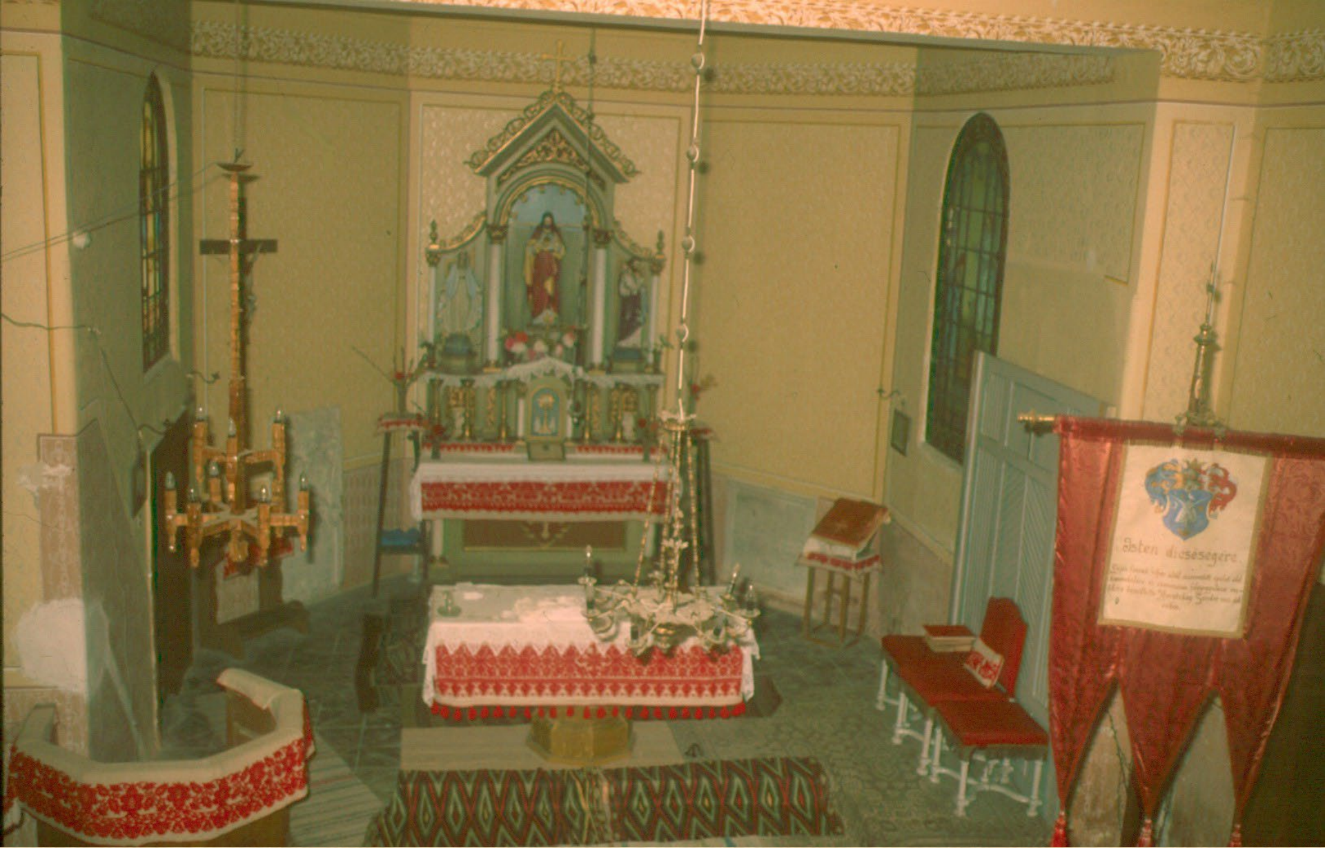
A torockószentgyörgyi katolikus templom