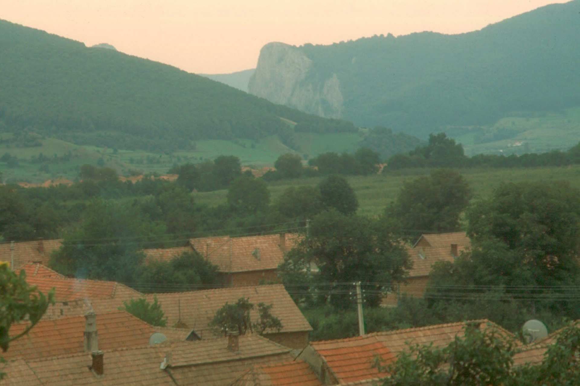
A Kőköz Torockószentgyörgy felől