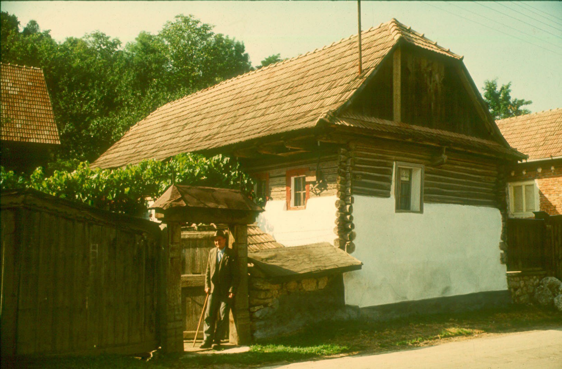
Jellegzetes, régi boronaház Torockón