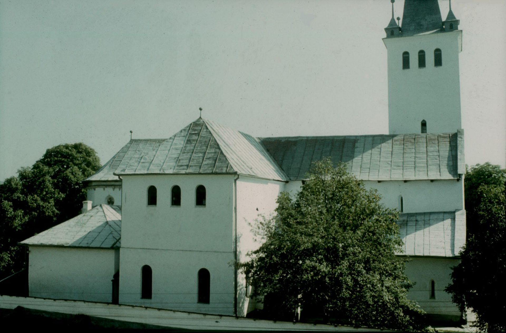
A református templom a parókia felől