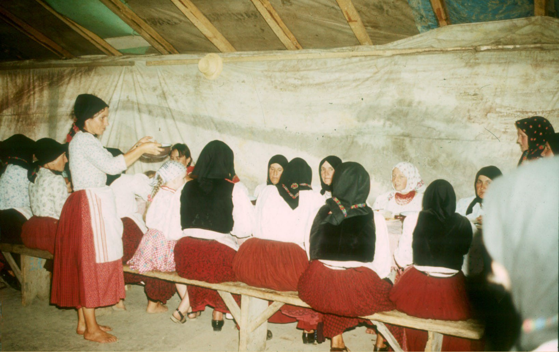
A kalákázók megvendégelése