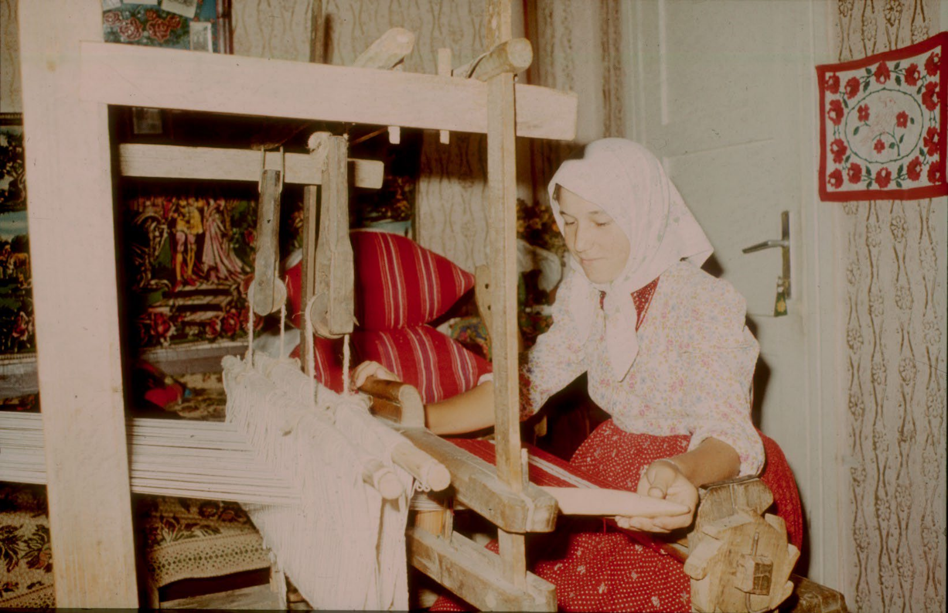
Az osztovátán (szövőszék) szövő, fiatal leány