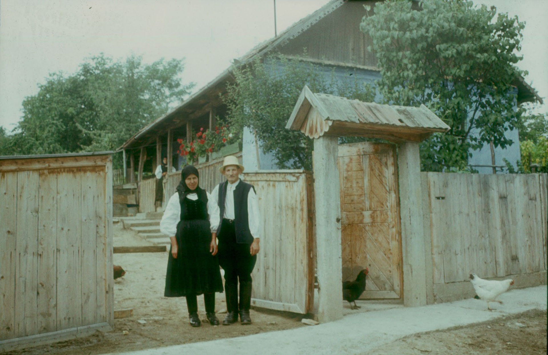
Módos gazda háza