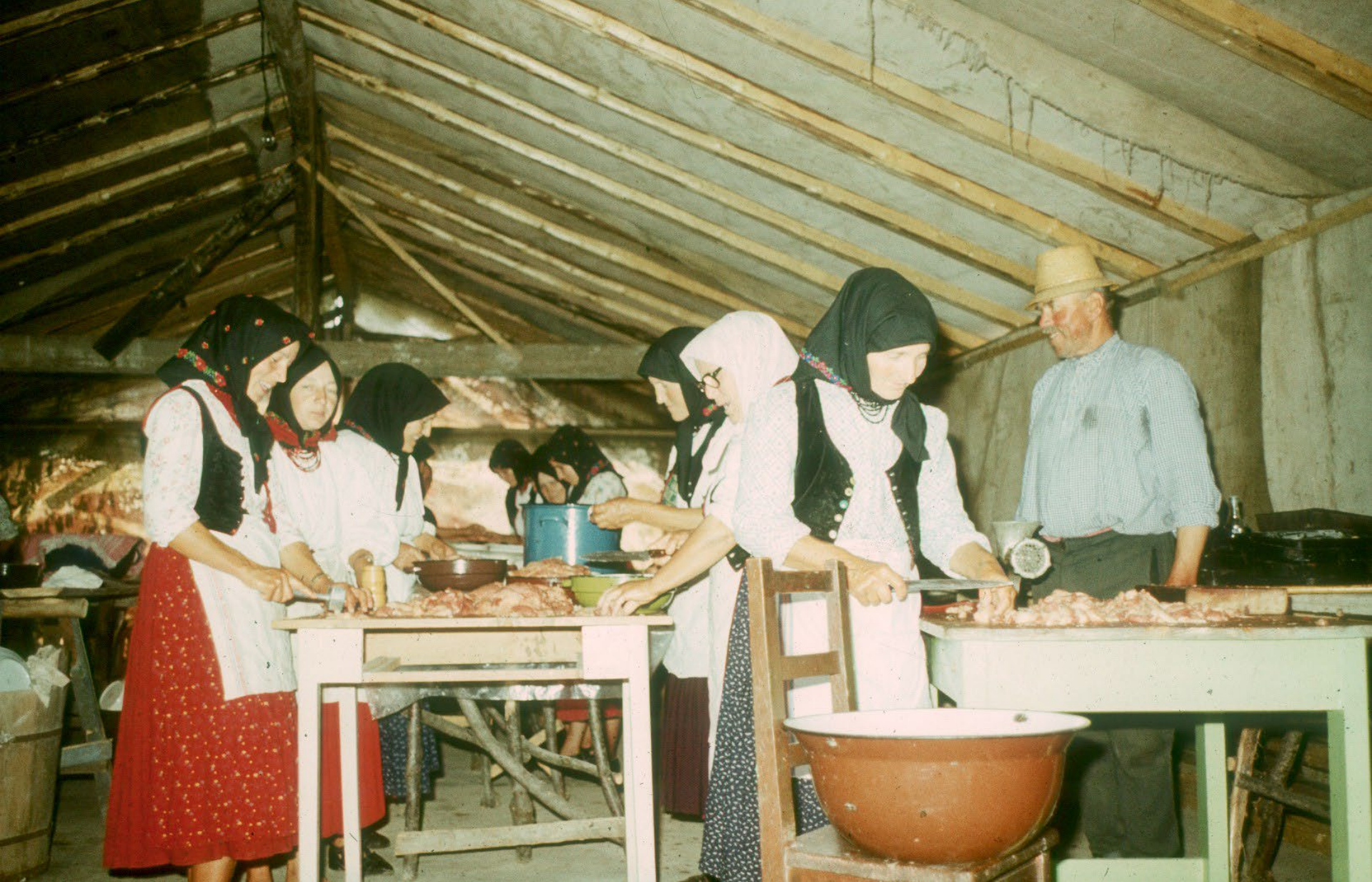
Az esküvő előkészítése a sátorban