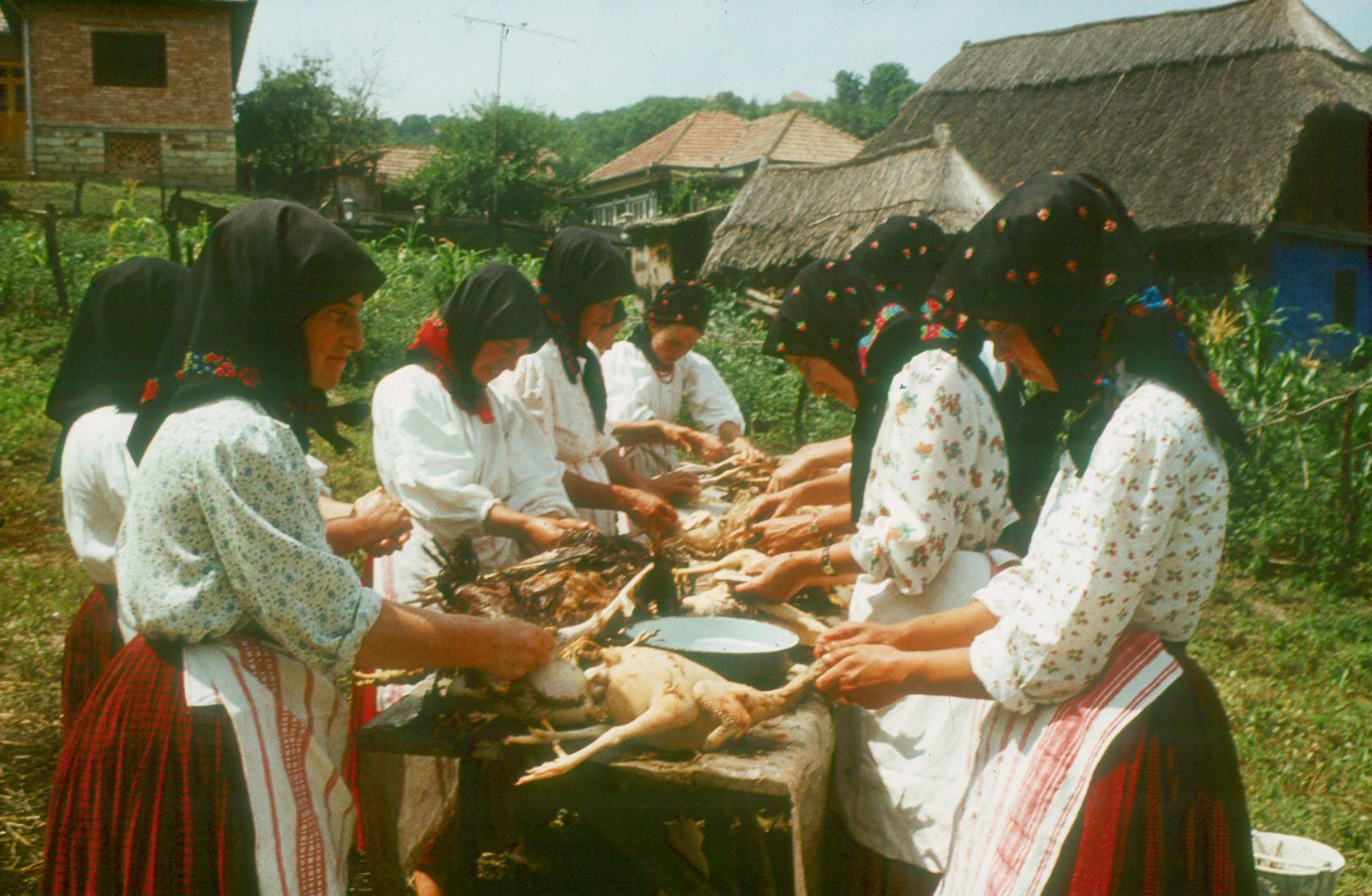
Eskövői előkészület kalákában