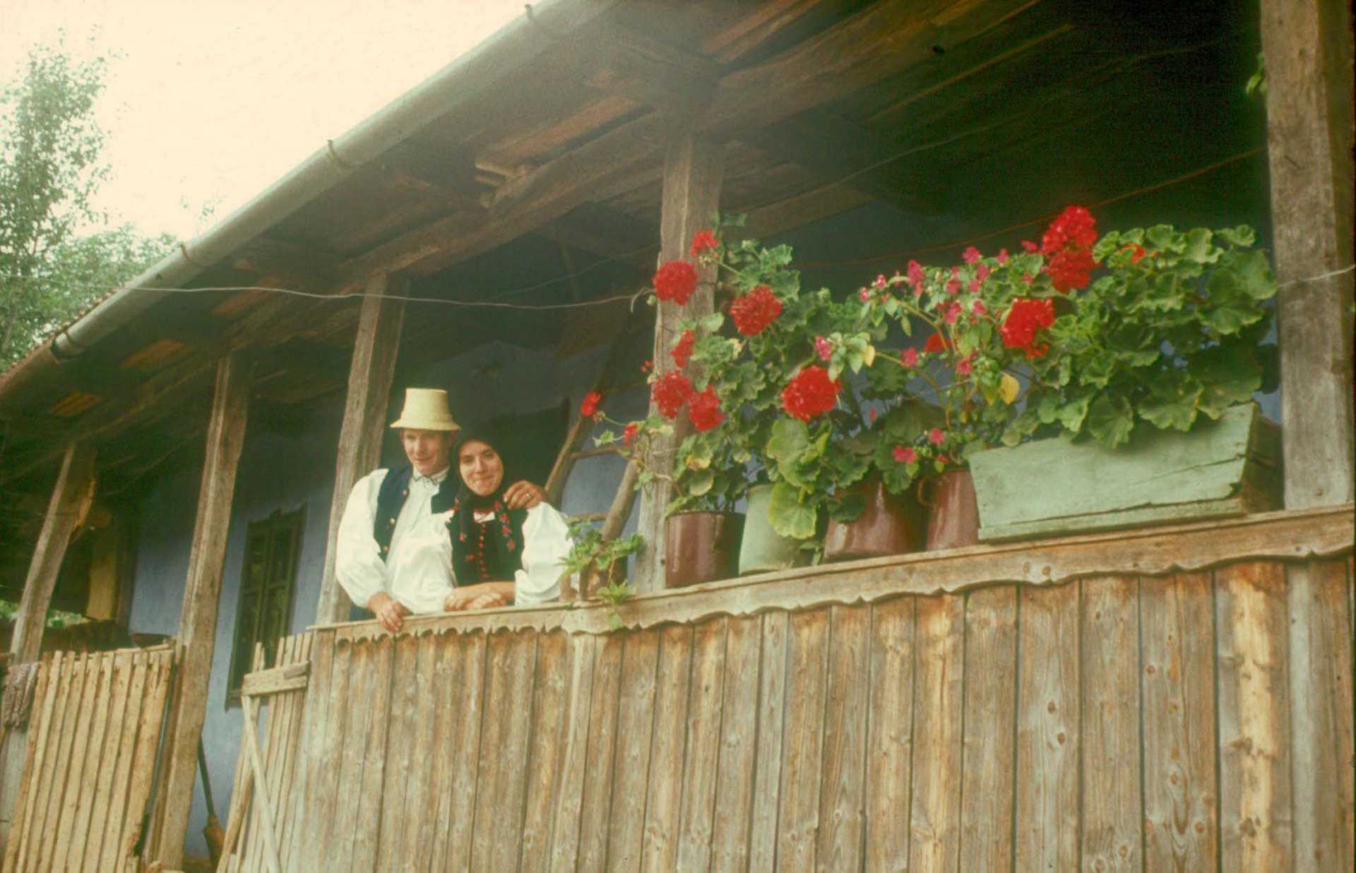
A módos gazda házának virágos tornáca