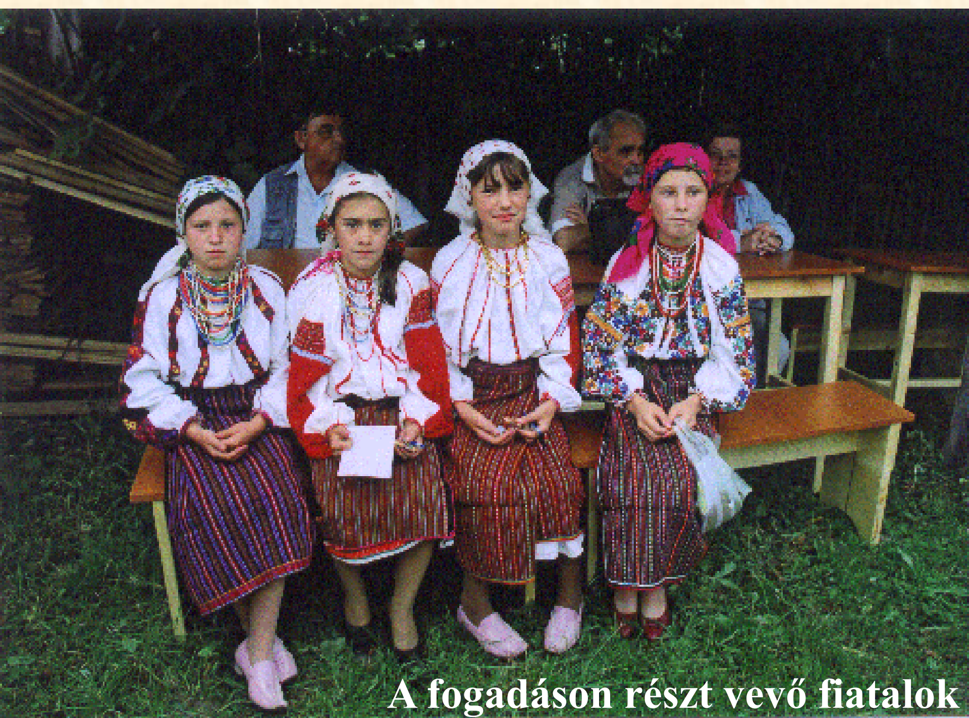
A fogadáson részt vevő fiatalok