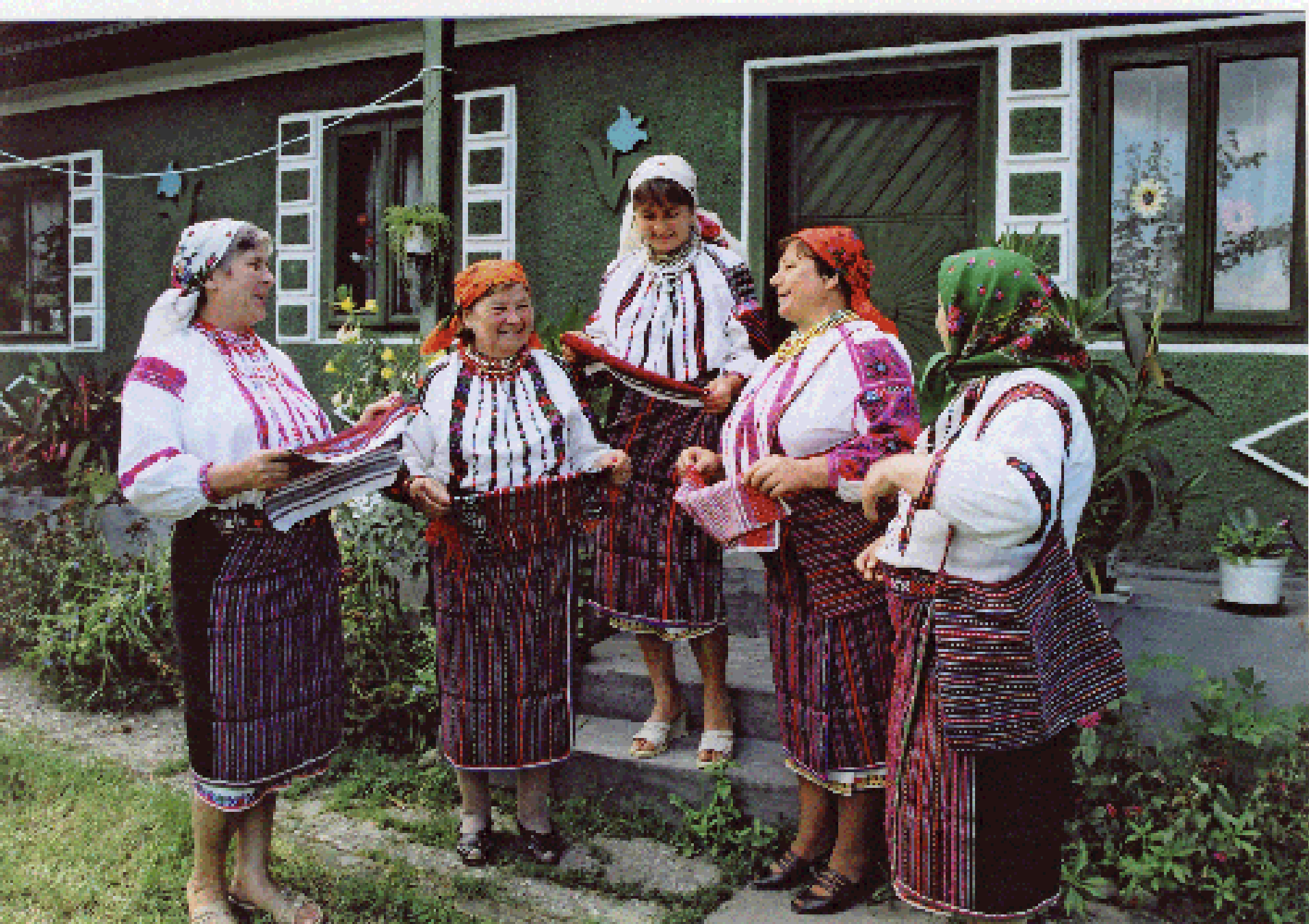
Szőttesekek bemutató asszonyok Lészpeden