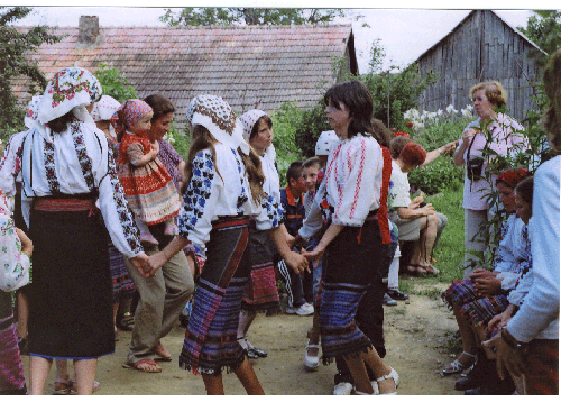
Táncoló csángó fiatalok Lészpeden és Somoskán