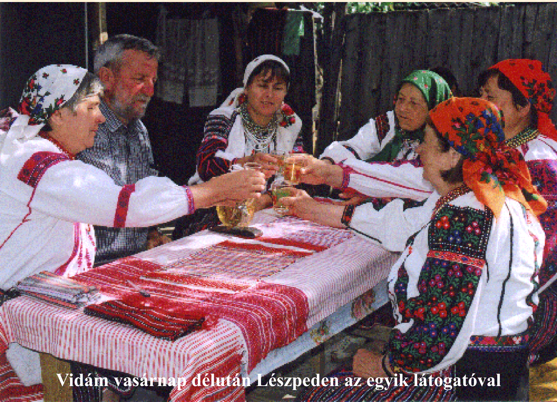
Vidám vasárnap délután Lészpeden az egyik látogatóval