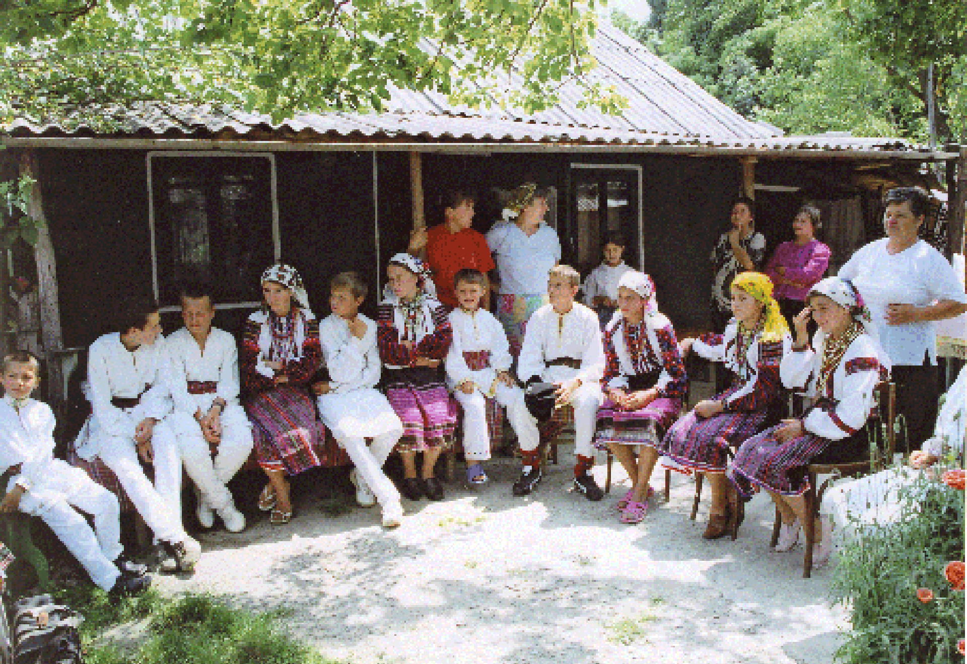
A fogadáson részt vevő fiatalok