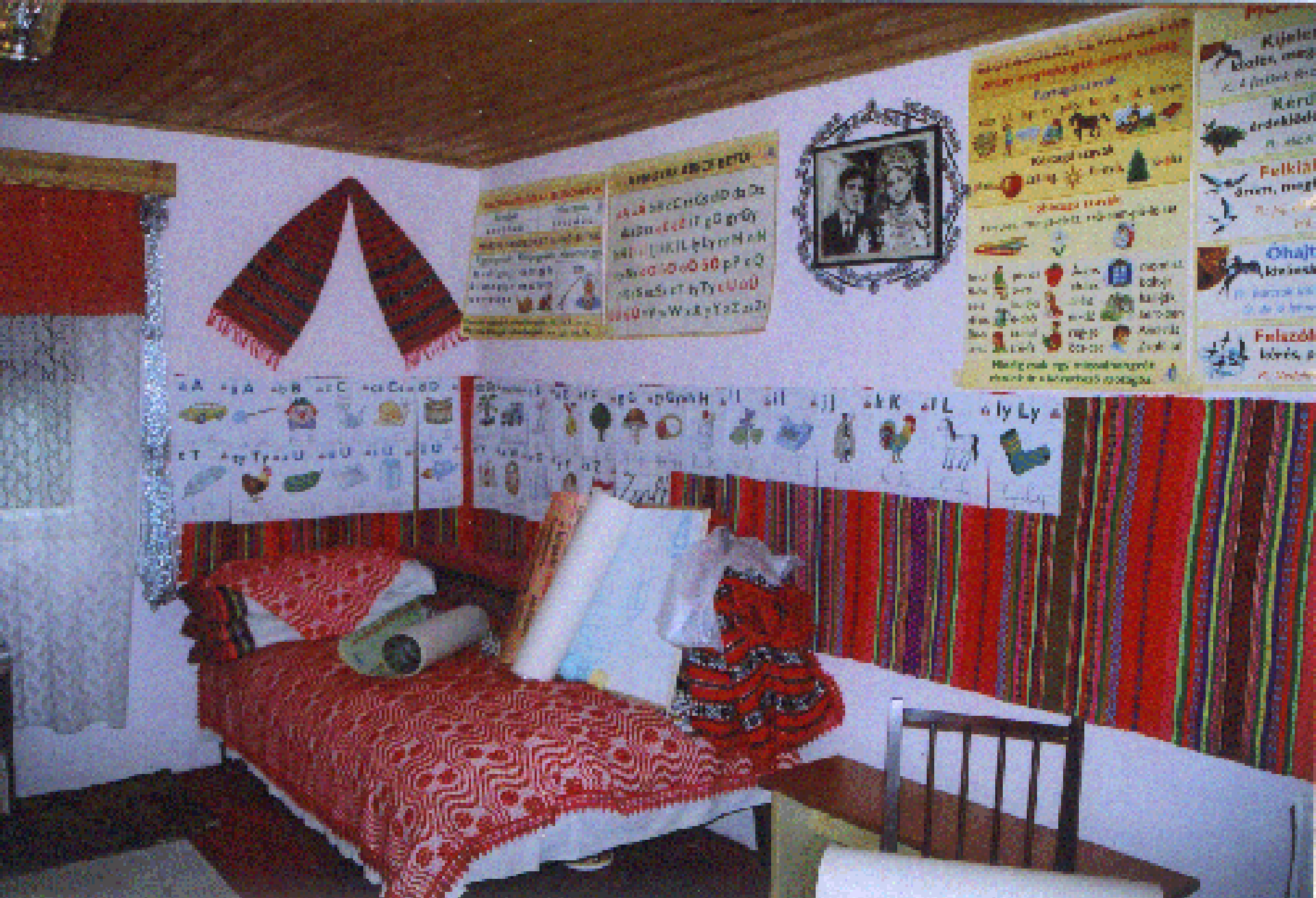
A pusztinai tanulószoba